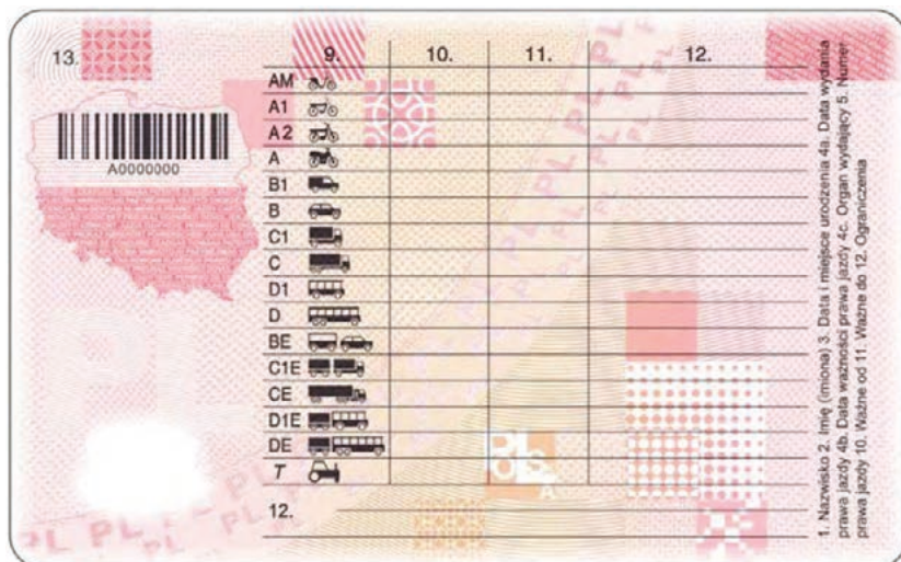
Fot. 2. Rewers prawa jazdy