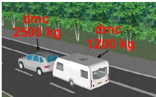
Fot. 7. Zespół pojazdów

Posiadając prawo jazdy kategorii B (bez żadnego kodu) można kierować między innymi pojazdem samochodowym o dopuszczalnej masie całkowitej do 3500 kg z przyczepą lekką - wtedy łączna masa (dmc) może wynosić maksymalnie 4250 kg. Prawo jazdy kat. B uprawnia także do jazdy pojazdem samochodowym z przyczepą inną niż lekka, jednak warunkiem jest, aby łączna dopuszczalna masa całkowita nie przekraczała 3500 kg. Aby kierować pojazdem samochodowym z przyczepą inną niż lekka, jeżeli łączna dopuszczalna masa całkowita zespołu pojazdów przekracza 3500 kg, a nie przekracza 4250 kg trzeba posiadać prawo jazdy kategorii B z kodem „96”. Jest to wygodne rozwiązanie dla niektórych osób, gdyż zainteresowana osoba nie musi przechodzić żadnego kursu, a tylko odbywa egzamin praktyczny w jednym z ośrodków WORD. Co prawda posiadana kategoria B+E pozwala na prowadzenie zespołu pojazdów o dopuszczalnej masie całkowitej nie przekraczającej 7000 kg (fot. 7), składającym się z pojazdu samochodowego (z wyjątkiem autobusu i motocykla) i przyczepy innej niż lekka, której dopuszczalna masa całkowita nie przekracza 3500 kg, jednak mnóstwo ludzi nie wykorzystuje tej masy i kierując zespołem pojazdów mieszczą się w granicy 4250 kg.