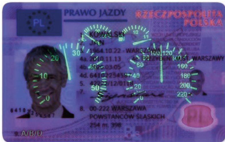
Fot. 3. Zabezpieczenia w dokumencie prawa jazdy (światło UV)

Prawo jazdy ma format karty identyfikacyjnej (układ poziomy) o wymiarze 85,595 mm (+/- 0,125 mm) x 53,975 mm (+/- 0,055 mm) i promieniu zaokrągleń w przedziale od 2,88 do 3,18 mm i grubości od 0,68 do 0,84 mm, wykonanej w 100% z wielowarstwowego poliwęglanu, przy czym warstwy zewnętrzne są przezroczyste, a warstwy środkowe nieprzezroczyste. Na karcie nadrukowano technikami offsetową i sitodrukową elementy graficzne i zabezpieczające, a techniką druku atramentowego (tzw. inkjetowego) naniesiono kolorową fotografię posiadacza prawa jazdy. Barwa tła prawa jazdy jest utrzymana w tonacji różowej. Barwa tekstu, symboli i znaków graficznych użyta na karcie prawa jazdy jest czarna. Wyjątkiem są napisy: WZÓR UNII EUROPEJSKIEJ” oraz „PRAWO JAZDY” w różnych językach, wydrukowane są w kolorze różowym, tak aby stanowiły tło prawa jazdy; w górnej części awersu, napis „PRAWO JAZDY” – wykonany jest farbą o barwie niebieskiej, a obok napis o treści „RZECZPOSPOLITA POLSKA” – wykonany farbą optycznie zmienną; w lewym górnym rogu znajduje się biały symbol „PL” wpisany w okrąg utworzony przez 12 gwiazdek o barwie żółtej, umieszczonych na niebieskim tle w kształcie prostokąta o wymiarze 17 x 10 mm.