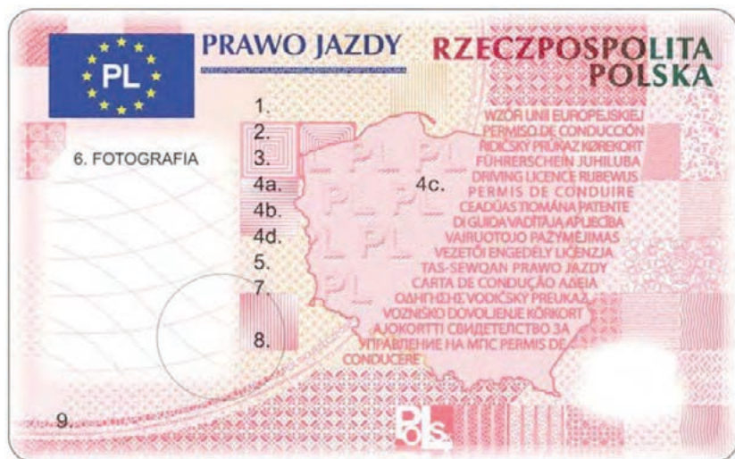
Fot. 1. Awers prawa jazdy