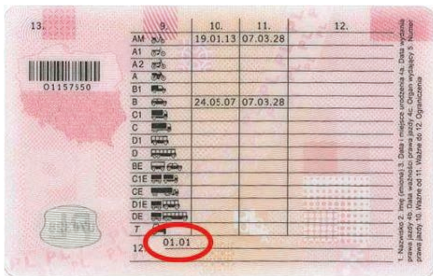
Fot. 6. Kod ograniczenia korekty wzroku

wzroku i kodem 01.01 w komórce 12 (fot. 6), którzy nawet nie wiedzą, że zamieniając okulary na soczewki kontaktowe, popełniają wykroczenie. Dlatego, jeżeli np. brak okularów nie przyczynił się do spowodowania kolizji czy wypadku, w pierwszej kolejności rolą policjanta jest pouczenie o tym, że używanie zarówno okularów jak i soczewek powinno w tym przypadku zostać uwzględnione w prawie jazdy, które trzeba wymienić, uzyskując odpowiednie orzeczenie okulisty. Również wtedy, jeśli od momentu wydania dokumentu wzrok wrócił do normy lub kierujący przeszedł np. laserową korekcję wzroku i nie musi już w ogóle nosić okularów. Z orzeczeniem powinien udać się do właściwego miejscowo wydziału komunikacji i wyrobić nowy dokument uwzględniający zmienione zalecenie lekarza. Jeżeli kierujący zamierza na stałe korzystać zarówno z okularów, jak i soczewek kontaktowych powinien się ubiegać o prawo jazdy z kodem 01.06 w rubryce 12.